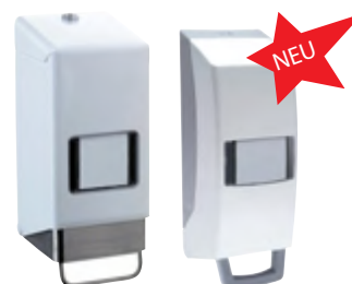
Typ SPENVARIO 2 Typ SPENVARIO 2 K