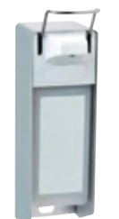
Typ SPENEURO 1

Weitere Optionen Online Ellenbogenhebel .....-E verschließbar .....-V